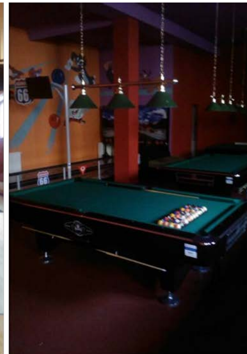
POR 4.3: Amenajarea unei sali de sport cu 2 linii de bowling si 3 mese biliard

Valoare proiect: 802.528 lei Suma nerambursabila 100% Credit BT 500.000 lei