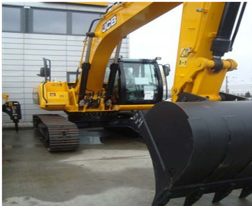
POR 4.3: “Crearea infrastructurii SC First Group Construct SRL de prestare a serviciilor in domeniul constructiilor” - Suceava

Valoare proiect: 1.048.177 lei Suma nerambursabila 836.000 lei Credit BT 753.000 lei